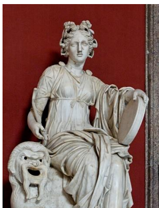
4. Талия _____ _____