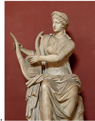
3. Терпсихора _____ _____