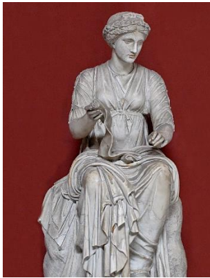
1. Клио _____ _____