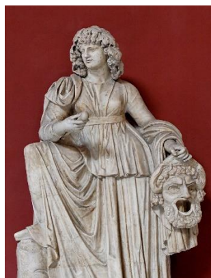
5. Мельпомена _____ _____