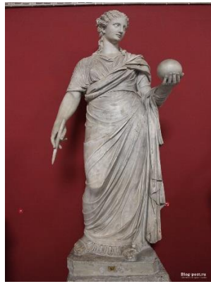
2. Урания _____ _____