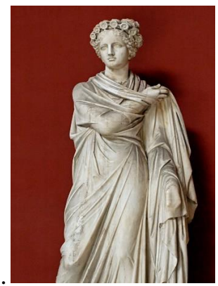
6. Полигимния _____ _____